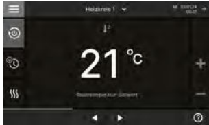
Écran tactile couleur 7 pouces

La Vitodens 222-F se commande via un écran tactile couleur 7 pouces avec affichage en texte clair et graphique, assistant de mise en service, affichage de la consommation d'énergie et, en option, via un terminal mobile.