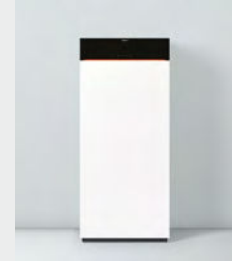
Vitodens 222-F Type B2TH