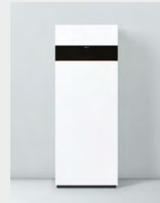
Vitodens 222-F Type B2SH

1) La classe d'efficacité énergétique du système de chauffage (combiné) est A dans une gamme allant de G à A+++.