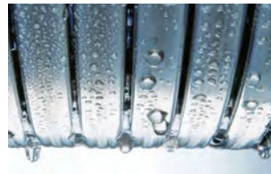
Échangeur de chaleur Inox-Radial

L'acier inoxydable fait la différence. L'échangeur de chaleur Inox-Radial en acier inoxydable résistant à la corrosion est le cœur de la Vitodens 222-F. Il transforme l'énergie utilisée en chaleur de manière particulièrement efficace. Pratiquement sans perte, avec un rendement de 98 %, difficile à surpasser. Et ce, avec la sécurité d'un acier inoxydable de haute qualité particulièrement durable et de haute qualité.