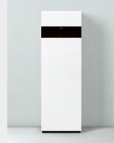
Vitodens 111-F Type B1SG

1) La classe d'efficacité énergétique pour le chauffage est A, sur une échelle de G à A +++ .