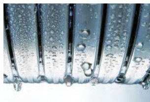
Échangeur de chaleur Inox-Radial

L'acier inoxydable fait toute la différence. L'échangeur de chaleur Inox-Radial en acier inoxydable résistant à la corrosion est l'atout majeur de la Vitodens 111-F. Il convertit efficacement l'énergie utilisée en chaleur. Et cela, avec la sécurité d'un matériau de qualité particulièrement durable.