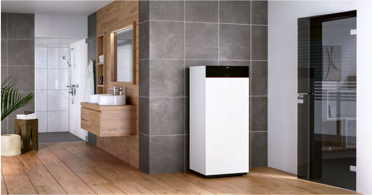
Vitodens 111-F au design élégant, couleur Vitopearlwhite