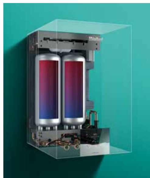
20 litres de stockage à l'arrière de la chaudière

ecoTEC plus VCI vous assure le chauffage et la production d'eau chaude dont vous avez besoin. Grâce à son échangeur de 27 plaques et sa fonction de temporisation, l'eau chaude est disponible très rapidement et la température reste stable même