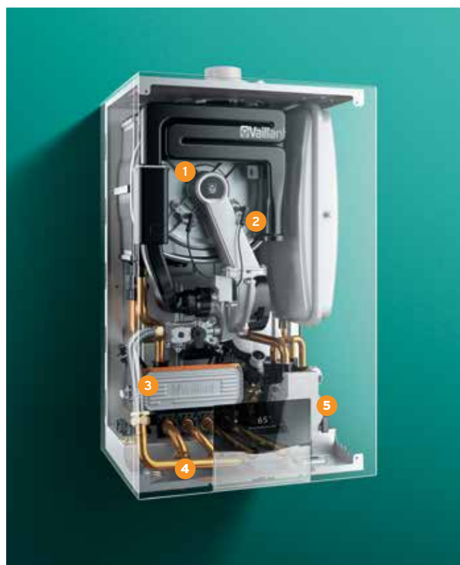
ecoTEC plus VCI, vue intérieure aux rayons X.

lors de la réouverture du robinet pour se rincer. Vous profitez ainsi d'un logement où il fait bon vivre, avec une température agréable et de l'eau chaude disponible rapidement dès que vous en avez besoin.