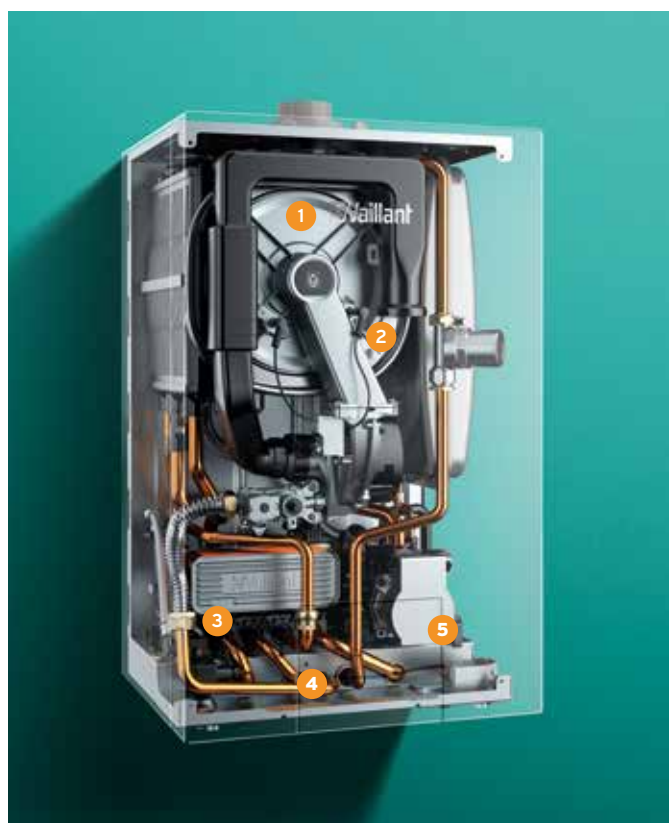
ecoTEC plus extraCONDENS, vue intérieure aux rayons X.