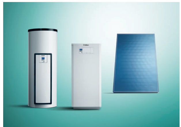
Système solaire Vaillant

Pour encore plus d'économies, vous pouvez également associer votre chaudière ecoVIT à un système solaire Vaillant. Vous bénéficiez ainsi de l'énergie gratuite du soleil.